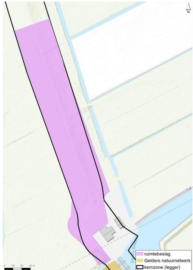
Figuur 2: Ruimtebeslag Voorkeursalternatief