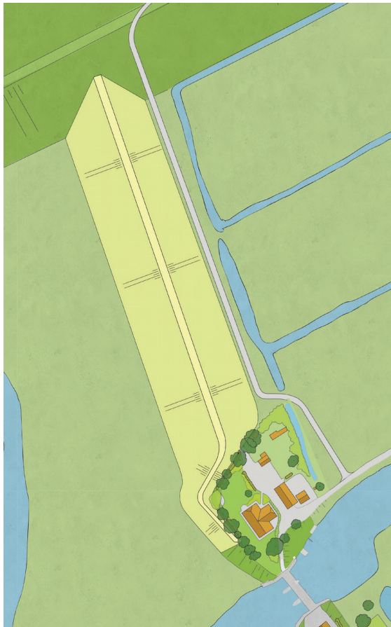
Figuur 1: Bovenaanzicht Voorkeursalternatief