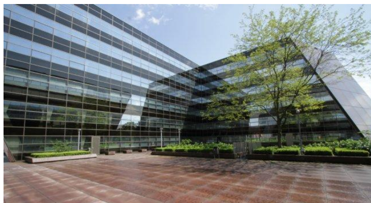
Hoofdkantoor waterschap Drents Overijsselse Delta

Website: www.wdodelta.nl E-mail: info@wdodelta.nl