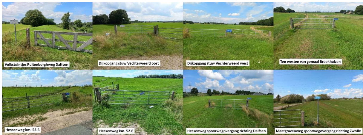
Figuur 1 Afsluitingen van de Vechtdijk ten westen van Dalfsen door de rechtsvoorganger van het WDOD

In 2017 is door het Algemeen Bestuur van WDOD de Nota Recreatief Medegebruik vastgesteld. De nota formuleert het principe van passieve openstelling van de eigendommen van het waterschap voor wandelaars maar zegt oog te hebben voor belangen van natuur en landschap, de overlast voor agrariërs en de privacy van naastgelegen eigenaren . De nota stelt op blz. 6 dat locaties waar door de rechtsvoorgangers van WDOD de openstelling is beëindigd, zullen worden getoetst , alvorens wordt besloten de trajecten afgesloten te houden dan wel opnieuw open te stellen. Zie figuur 1 voor een overzicht van afgesloten locaties lang de Vechtdijk. Kortom, een genuanceerde nota.