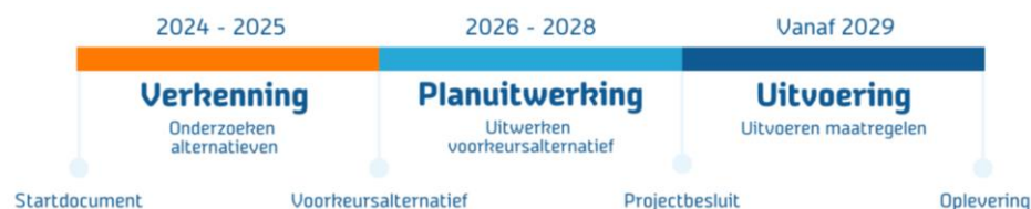
Figuur 2 Planning van het project op hoofdlijnen