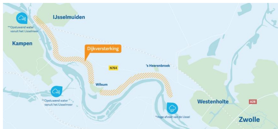
Figuur 3 Waterveiligheidsopgave traject 10-3 Mastenbroek-IJssel (zichtjaar 2080)

Uit de beoordeling van dit traject blijkt dat 10,8 km van de 14,6 km niet voldoet aan de wettelijke veiligheidseisen. Het deel van de IJsseldijk tussen de Spooldersluis tot en met de dijk rond Westenholte en het hoge deel van de dijk in het dorp Wilsum zijn sterk en hoog genoeg en hoeven niet versterkt te worden. Figuur 3 geeft de delen van de dijk weer die versterkt moeten worden. In de verkenningsfase de komende jaren wordt onderzocht tot waar de dijk moet worden versterkt.