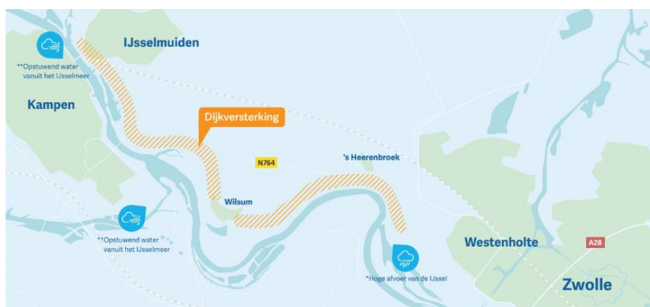
Figuur 1 Ligging projectgebied

De IJsseldijk tussen Zwolle en IJsselmuiden wordt in de Waterwet normtraject 10-3 genoemd. Vanaf de Spooldersluis in Zwolle loopt het traject stroomafwaarts richting IJsselmuiden. Het hele normtraject is in totaal 14,6 km lang. Hiervan moet bijna 11 km versterkt worden. De ligging van het projectgebied is weergegeven in Figuur 1 met een oranje arcering.