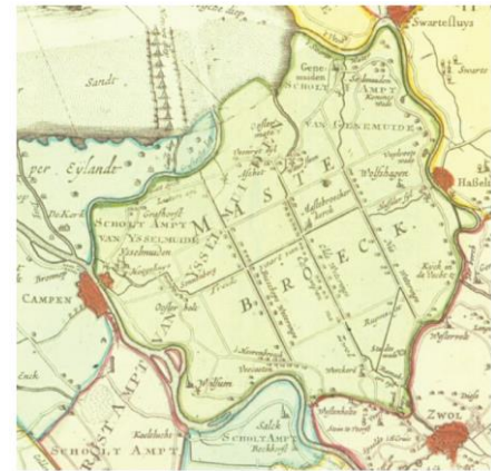
Kaart uit 1750 van de Mastenbroekpolder.

Het gebied is regelmatig geteisterd door overstromingen. Uit de laatste eeuwen hebben vooral de stormvloed en uit 1775, 1825 en 1916 veel schade veroorzaakt. De verschillende kolken in het gebied vormen hiervan de stille getuigen.