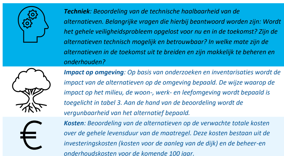
Tabel 2 Thema's afwegingskader

Voor een zorgvuldig besluit over een voorkeursalternatief, worden de voor- en nadelen van de oplossingen in beeld gebracht en afgewogen. Om goed onderbouwd een voorkeursalternatief te selecteren, hanteert het waterschap hiervoor een zogeheten afwegingskader, zie tabel 2. Dit kader is afgeleid uit de eisen van het Hoogwaterbeschermingsprogramma en bestaat uit drie thema's: techniek, impact op de omgeving en kosten.