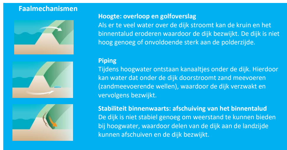
Figuur 4 Faalmechanismen dijkversterking

Een dijk kan op meerder manieren zijn functie verliezen en doorbreken. Dit worden faalmechanismen genoemd. De IJsseldijk is afgekeurd op verschillende faalmechanismen. Dit zijn onder andere hoogte (overloop en overslag), piping, stabiliteit binnenwaarts. In figuur 4 is toegelicht hoe deze faalmechanismen werken.