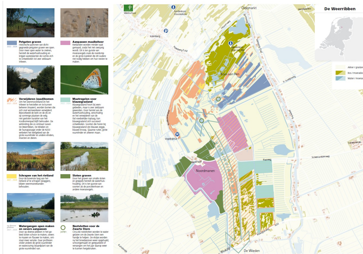
Figuur 2 Inrichtingsplan Noordmanen en Kooi van Pen