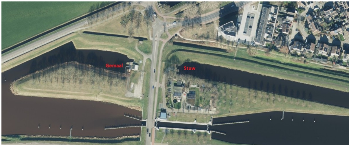
Figuur 2 Afbeelding gemaal en stuw Nieuwebrugsluis.